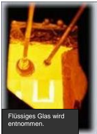
Flüssiges Glas wird entnommen.

Glas ist ein magischer Stoff. Es umschließt seinen Inhalt, ohne sich mit ihm zu verbinden. Form und Funktion sind eins. Glas regt die Fantasie an und deshalb entwickelte sich seine Herstellung zu einer der innovativsten Handwerkskünste. Die vielen Menschen, die in Gemeinschaft aus dem Formlosen die Form schaffen. Die Glaspeife, die in die Glut taucht und den Tropfen zur Kugel aufbläst, dann hinein in die Form, wieder blasen, drehen und öffnen. Und alles in Sekundenschnelle, mit großer Präzision, denn zwischen flüssig und fest liegt nur ein Augenblick. So geht es den ganzen Tag. Nicht jedes Mundgeblasene Objekt, Glas, Vase oder Windlicht erreicht sein Ziel, denn in dem Auf und Ab von Blasen, Formen, Drehen, Schneiden, Ansetzen und Ziehen entscheiden die Sekunde und das Können.