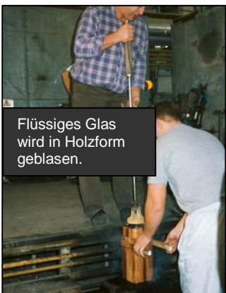
Flüssiges Glas wird in Holzform geblasen.