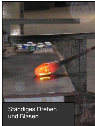
Ständiges Drehen und Blasen.