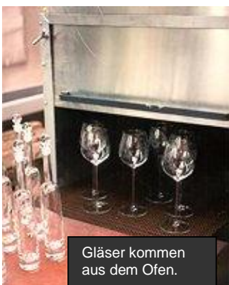
Gläser kommen aus dem Ofen.